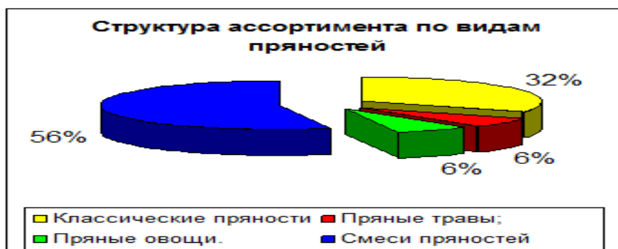
Рисунок 2.2. Динамика производства товаров, их структуру

Диаграммы эффективны в тех случаях, когда их точность не является основной задачей, а необходимо путем глазомерной оценки быстро определить превосходство одного процесса или явления над другими.