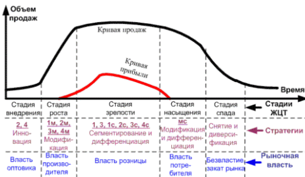
Рисунок 2.1 Стадии жизненного цикла товаров

Каждая иллюстрация должна пояснять текст, то есть давать возможность наглядного восприятия явлений, процессов и подытоживать цифровые данные.