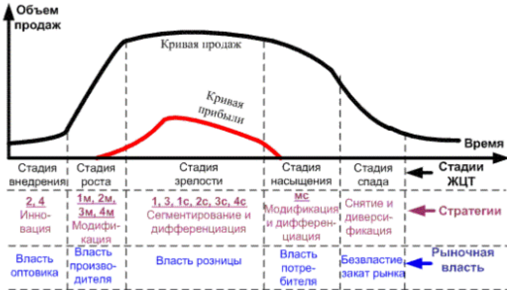
Рисунок 2.1 Стадии жизненного цикла товаров

Слово «Рисунок» и наименование помещают после пояснительных данных и располагают следующим образом: