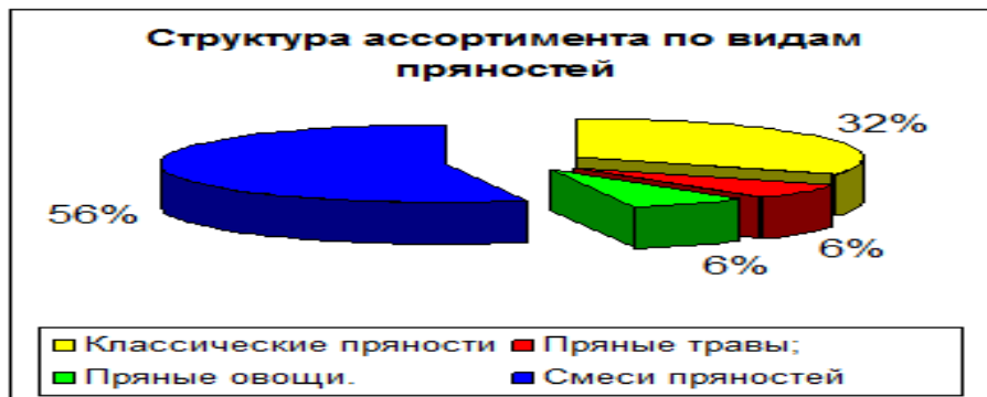
Рисунок 2.2 Динамика производства товаров, их структуру

Диаграммы эффективны в тех случаях, когда их точность не является основной задачей, а необходимо путем глазомерной оценки быстро определить превосходство одного процесса или явления над другими.