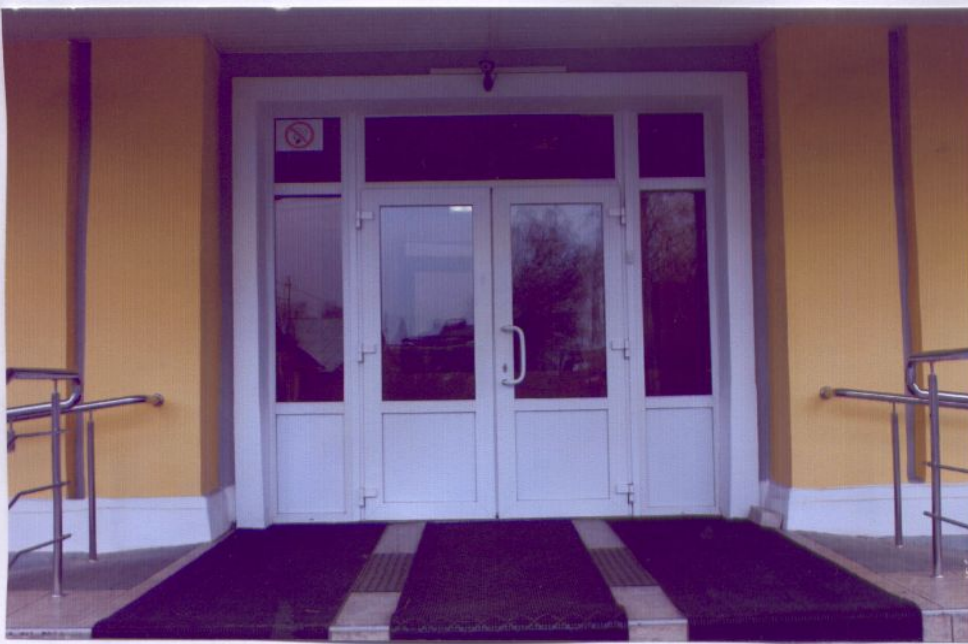
3. Лестница наружная