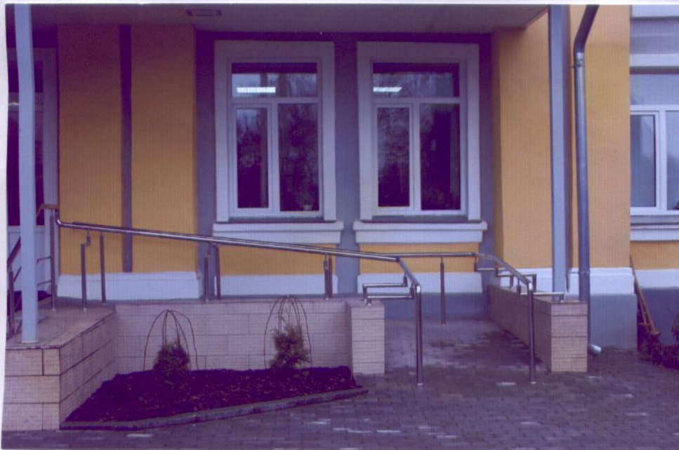
4. Пандус наружный