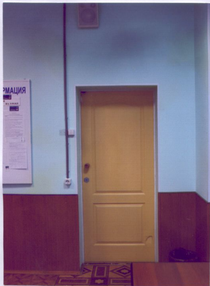
12. Вход в кабинет