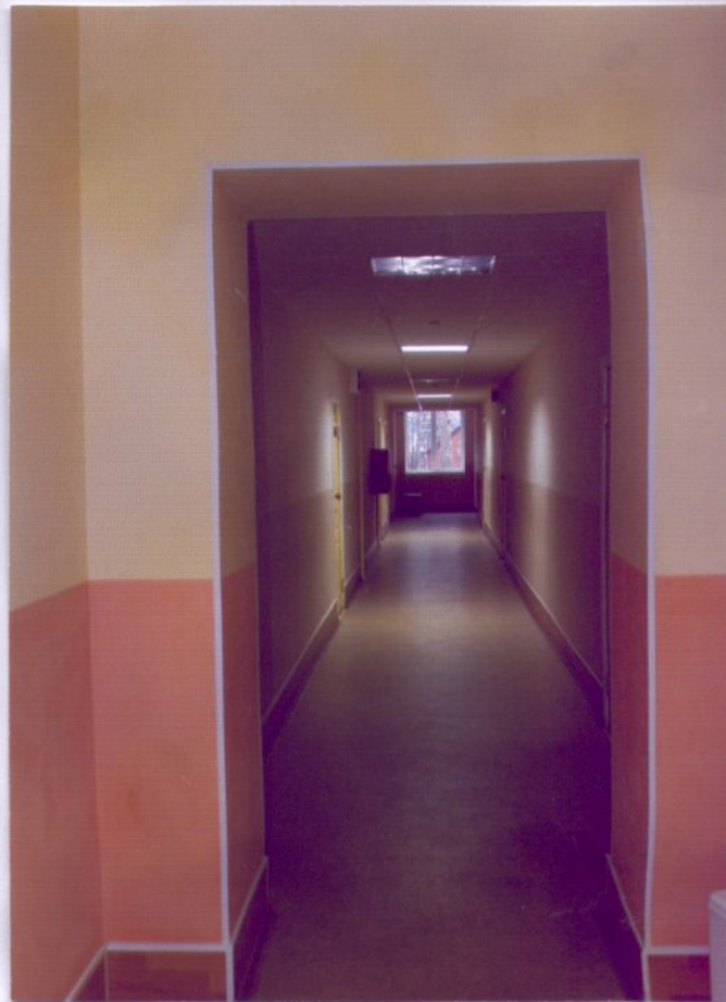
10. Пути эвакуации (коридор)