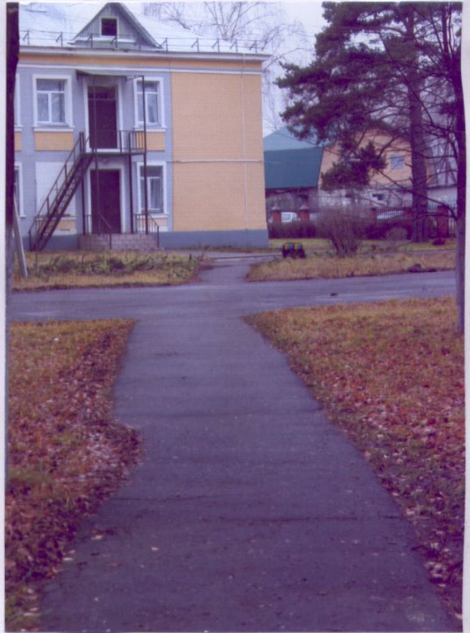
1. Пути движения