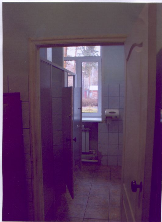
13. Туалетная комната