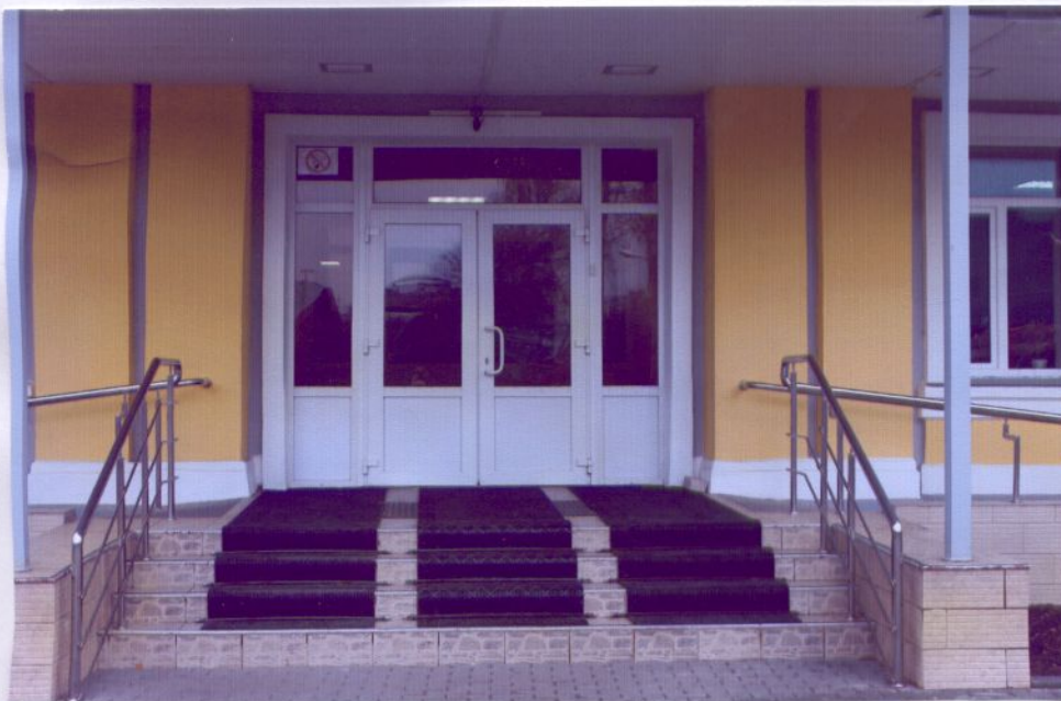
5. Дверь входная