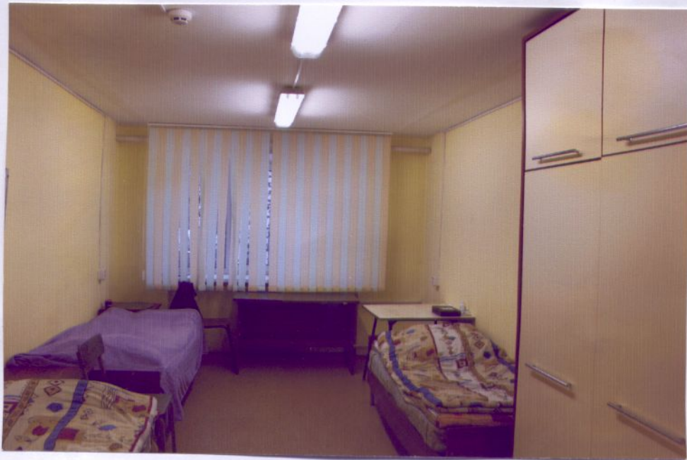
23. Жилая комната