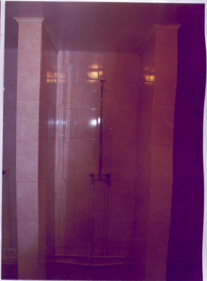
24. Душевая комната