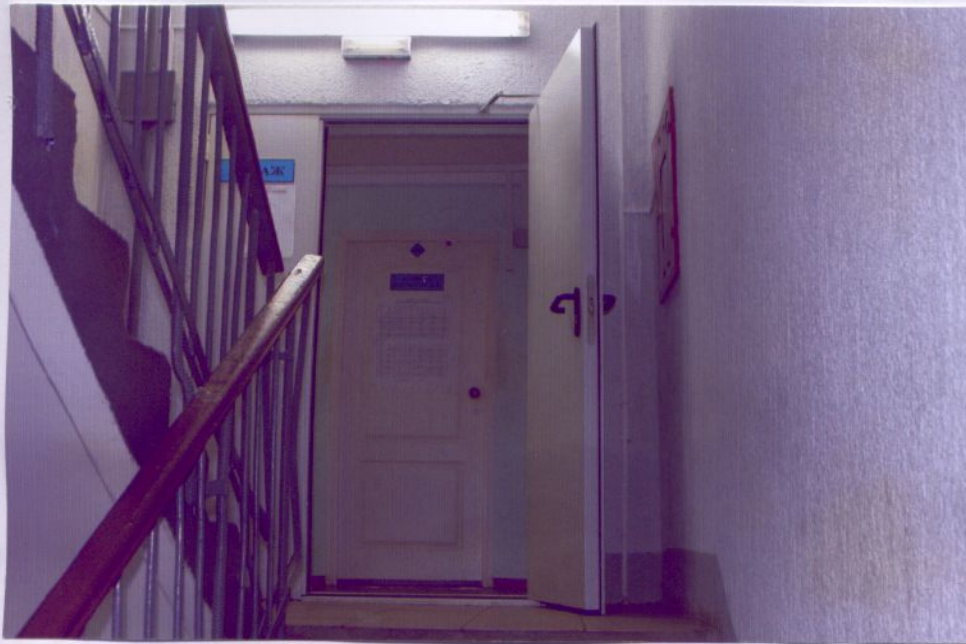
20. Дверь на этаж