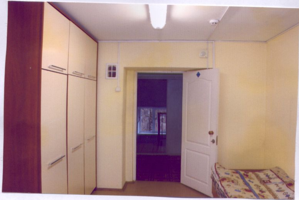
22. Жилая комната