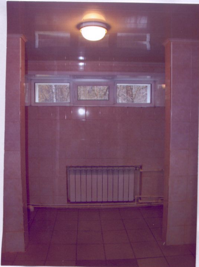
23. Душевая комната