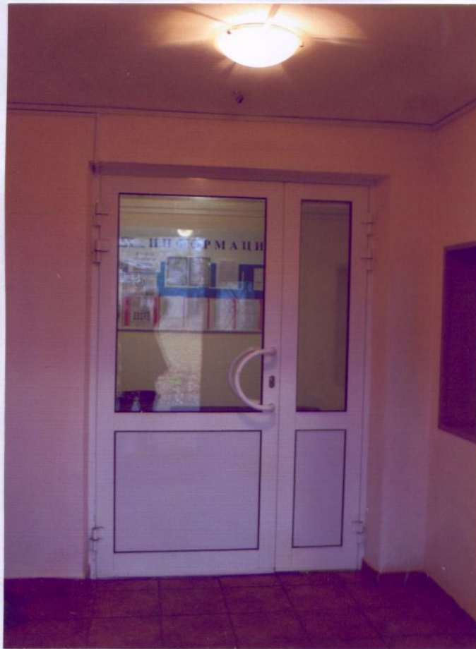
21. Дверь в вестибюль