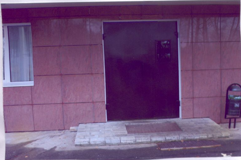
14. Входная площадка