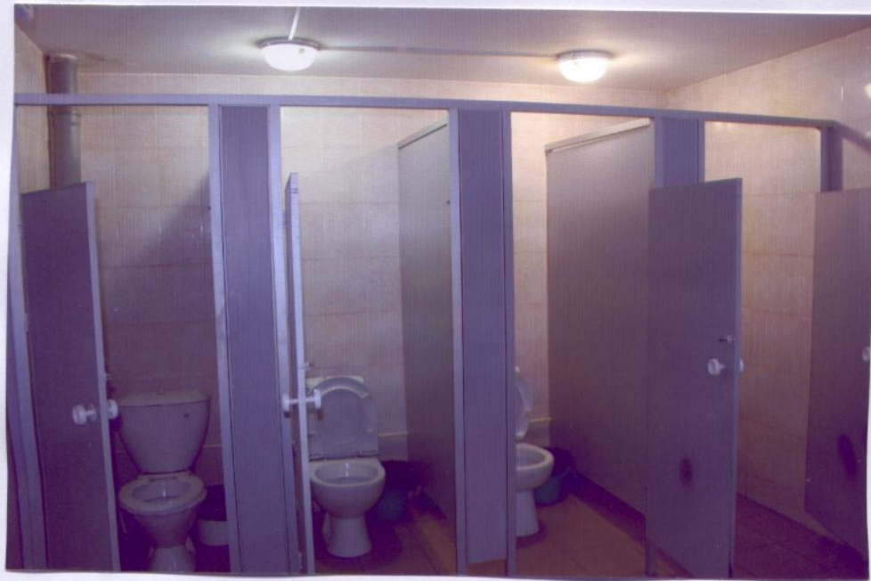
24. Туалетная комната